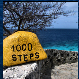
Rondje Noord en Zuid