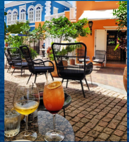
Uitgaan op Bonaire